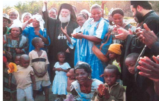
Μέ τό «μικρό ποίμνιο» τοῦ ἁγ. Δημητρίου στήν Ebolowa.

Συναντήθηκε ἐγκάρδια μέ τοὺς Ὀρθοδόξους νέους τοῦ Καμερούν, τό Φιλανθρωπικό σύλλογο τῶν Ὀρθοδόξων Γυναικῶν, τά μέλη τῶν Ἑλληνικῶν Κοινοτήτων ἀλλά καί μέ στελέχη τῆς πολιτικῆς ζωῆς τοῦ τόπου, συζητώντας ἐγκάρδια τά ἰδιαίτερα προβλήματα καί τίς ἀνάγκες πού ἀντιμετωπίζουν εἴτε ὡς ἐκκλησιαστικές ὁμάδες εἴτε ὡς πρόσωπα. Τήν Κυριακή 23 Ἰανουαρίου μέσα