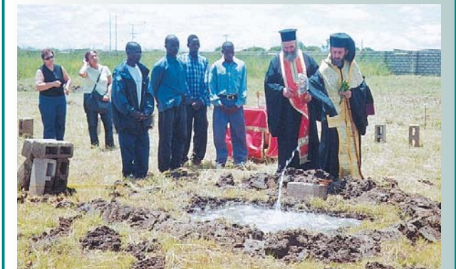
Θεμελίωση τοῦ πρώτου Ὀρθόδοξου ναοῦ στή Λουζάκα.