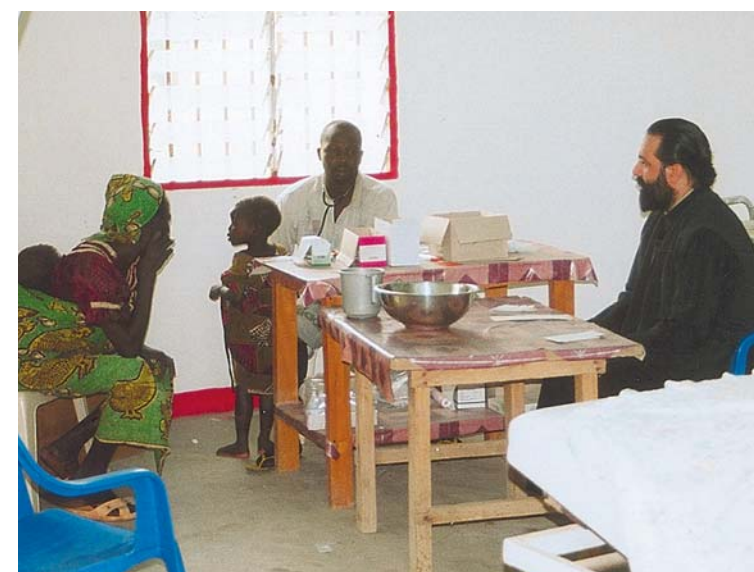
Πάντα τά έδνη