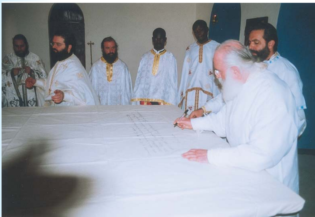
Ο Σεβ. Μητροπολίτης Ξάνθης κ. Παντελεήμων τελεί τά έγκαίνια του Ιεροῦ Ναοῦ Ἁγίου Παντελεήμονος.

Οι συμμετέχοντες άφίχθησαν στο Καμερούν, μετά από πολύωρο ταξίδι τό βράδυ της Τρίτης 10ης Ιανουαρίου και την επομένη ανέχωρησαν για τό Βόρειο Καμερούν. Από τη Μάρουα ταξίδεψαν στο ιεραποστολικό κέντρο του Κατράνγκ όπου τό απόγευμα της Πέμπτης 12ης Ιανουαρίου ο Σεβ. Μητροπολίτης μας έθεσε τό θεμέλιο λίθο για την ανέγερση μίας κλινικής και της αίθουσας πολλαπλών χρήσεων. Τό έργο αυτό πραγματοποιείται μέ τή χρηματοδότηση του Υπουργείου Έξωτερικών μέσω της Μ.Κ.Ο. "ΠΝΟΗ" της Μητροπόλεως μας και θά έξυπηρετήσει ανάγκες θεραπείας και νοσηλείας χιλιάδων ανθρώπων πού κατοικούν στην