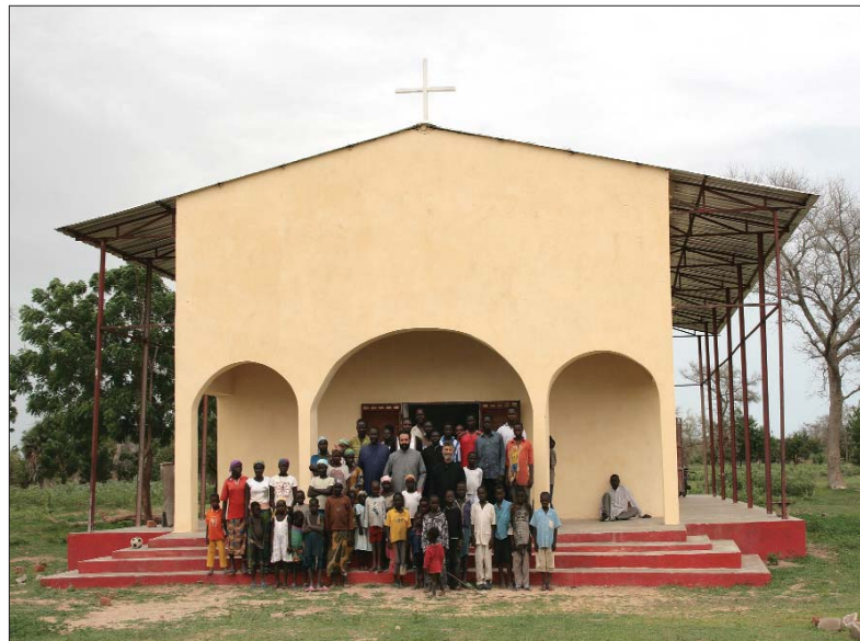
Πάντα τά έθνη

Ή πολυγαμία –(θέμα άκόμη άθικτο)– καί ή έθιμική πρακτική τών παραδοσιακών γάμων, εύρέως διαδομένη σέ όλλες σχεδόν τίς φυλές είναι ένα πρόβλημα πού έμφανίζει ένα ποσοστό μόνον 10% τών πιστών τής Ρωμαιοκαθολικής καί αλλήλων όμολογιών νά έχουν συνάψει θρησκευτικό γάμο καί ένα αλλιο 30% μόνον πολιτικό γάμο. Τοῦτο δέ, διότι ή οικογένεια τής γυναίκας δέν έπιτρέπει τήν τέλεση θρησκευτικοῦ ή πολιτικοῦ γάμου άν δέν αποπληρωθεί ή προίκα εκ μέρους του γαμπροῦ. Ό γαμπρός λαμβάνει από τήν οικογένεια τής νύμφης μία λίστα προίκας, πού πρέπει νά αποδώσει. Συνήθως αποδίδει άμέσως ένα 10% τής προίκας, παίρνει τή γυναίκα, τεκνοποιεί καί μετά από χρόνια όταν θά έχει ξεπληρώσει καί τό υπόλοιπο 90%, θά έπιτραπεί από τήν οικογένεια νά γίνει πολιτικός καί θρησκευτικός γάμος. Έτσι, λοιπόν, θά πρέπει ή κατηχητική μας προσπάθεια νά δια-